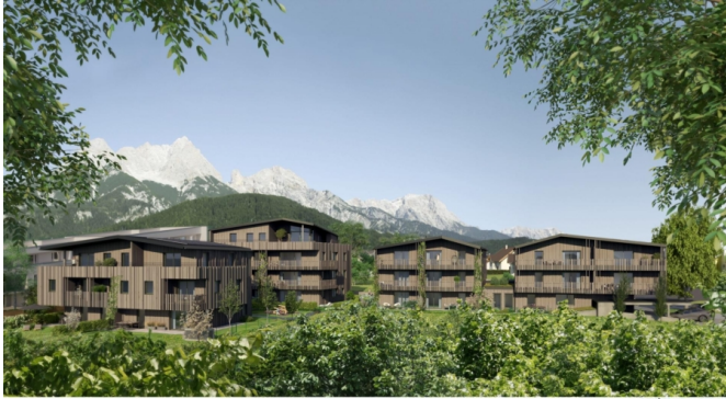
4007 Am Kukuruz in Saalfelden_Aussen Stp_01 re_06_