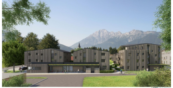
4007 Am Kukuruz in Saalfelden_Aussen Stp_08 Tag re